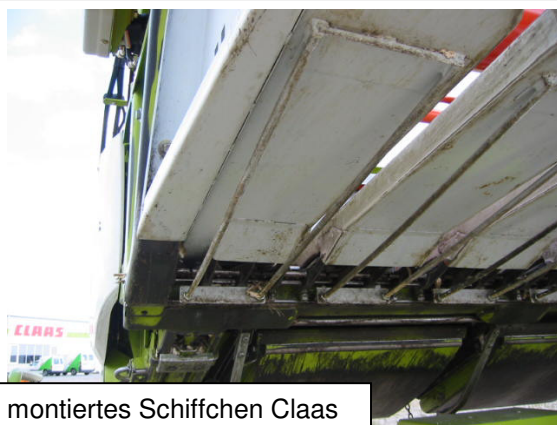
montiertes Schiffchen Claas