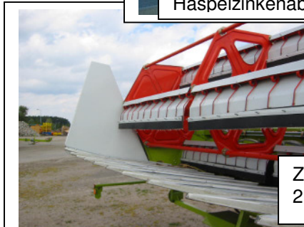
Zinken an jedem 2. Rohr demontieren